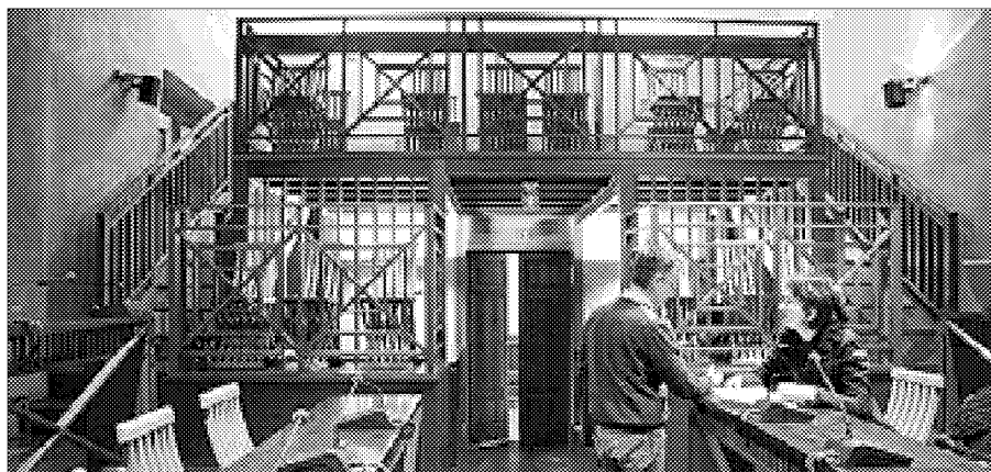
Sedute del Consiglio "live" grazie alla nuova telecamera

LUGO - Giovedì 18 febbraio: ovvero la prima volta delle telecamere in Consiglio comunale, un nuovo servizio, annunciato da tempo dalla Giunta Cortesi che è stato inaugurato pochi giorni fa, dopo che i capigruppo di tutte le forze politiche presenti in consiglio si sono espresse favorevolmente al termine di una riunione tenutasi prima della seduta in questione. Ora è possibile seguire on-line le dirette del Consiglio comunale e, volendo, poter consultare la registrazione audio video dell'ultima seduta. Tutto questo sarà disponibile sul sito del Comune. Il link alla diretta audio video ed il filmato verranno pubblicati, a partire dalla home page, nella sezione "Comune di Lugo informa - Sedute del Consiglio Comunale". La ripresa video avviene con una telecamera fissa ad alta risoluzione posizionata in alto, al centro della porta di ingresso della sala. Il filmato registrato è dotato di audio derivante dal circuito di amplificazione, proprio per garantire un'alta qualità. La diretta può essere seguita utilizzando semplice-