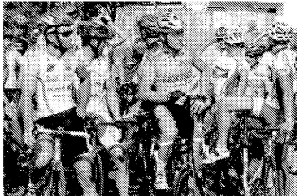
CICLISMO E' una delle discipline in cui si sfideranno i rappresentanti dei 10 Comuni della Bassa Romagna