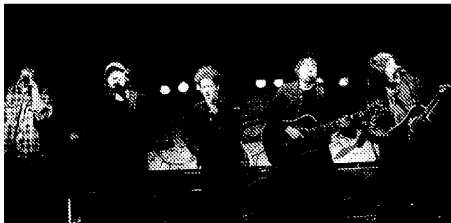
I musicisti del "Light of day benefit"

Alcuni dei protagonisti di quelle notti si esibiranno a Lugo sempre con quello spirito di grande generosità.