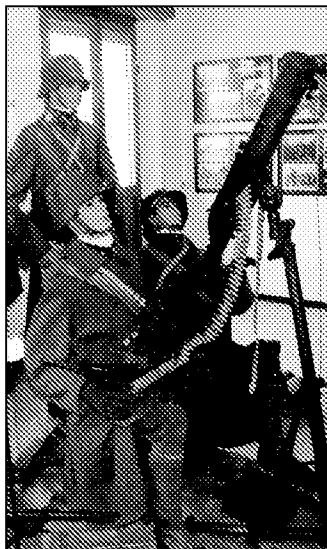
Un gruppo di armati