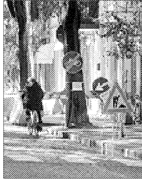
Lavori in corso