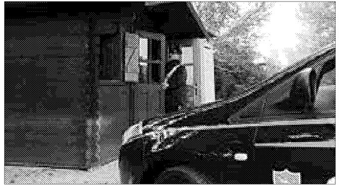
I carabinieri intervenuti dopo il raid vandalico di alcuni giovani al Parco del Loto

pubblicani "molto minore è risaputo che purtroppo è l'impegno delle famiglie in tal senso". Il Pri cittadino si chiede come mai "in una notte come quella di Halloween non siano state prese misure di prevenzione contro eventuali atti vandalici, magari con la predisposizione di un servizio di vigilanza affidato ai vigili di quartiere o alle forze di polizia addette all'ordine pubblico". Il solo servizio di routine - continua la nota - "non copre nelle ore notturne il centro storico e le zone come il parco del Loto, il Tondo, il quartiere sportivo". "Le autorità competenti, in sinergia - conclude la nota dei repubblicani -, devono