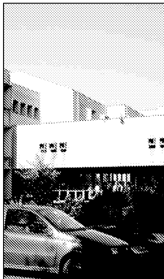
L'istituto tecnico commerciale "Compagnoni" di via Lumagni