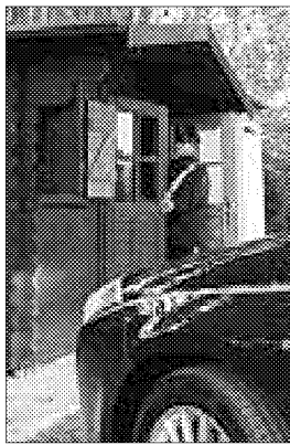
Acciuffati dai carabinieri

simo che va in scena al parco del Loto. L'ultimo, a fine marzo, quando fu presa di mira la torretta di avvistamento ai bordi del laghetto. Protagonisti, allora, erano 7 ragazzini, tra i 14 e i 17 anni.