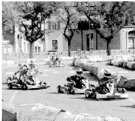
KART Domenica in piazza Garibaldi si è disputato il 12° Memorial Melandri