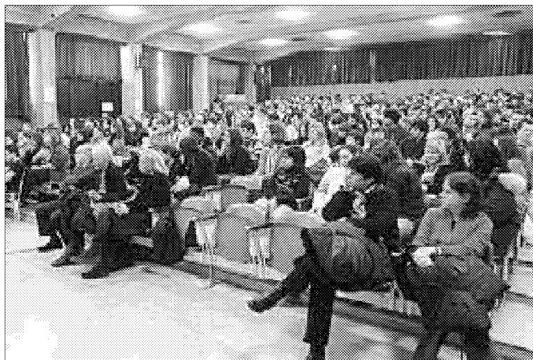
Studenti nell'aula magna del Liceo scientifico "Ricci Curbastro"

giugno e luglio scorso. Questo il motivo che ha fatto scattare la protesta, al momento ferma però al semplice novero delle idee. Quella che tiene più banco è la possibilità di far saltare le gite scolastiche, creando così un disagio agli studenti e quindi un'ampia risonanza al gesto. Però c'è chi, tra gli insegnanti, pensa anche a sospendere le adozioni dei nuovi libri di testo, suscitando questa volta le ire degli editori. A quanto pare, si viaggia ancora nel campo delle ipotesi, nel senso che di ufficiale non ci sarebbe ancora nulla. Anche se le notizie sono in parte contraddittorie: alcuni professori, infatti, nella mattinata di sabato avrebbero raccontato ai ragazzi che la maggioranza del collegio docenti si sarebbe già espressa per abolire le gite. Ma di conferme, nemmeno l'ombra. Resta il disappunto degli insegnanti, oltre a quello degli studenti, che potrebbero dover dire addio alle tanto amate gite.