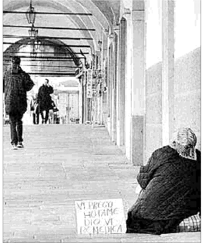
La crisi economica si fa sentire. In aumento le richieste di sostegno e aiuto alle organizzazioni, cattoliche e non, che si occupano contrastare la povertà

San Giacomo Maggiore in via Mazzini. Allo sportello - sostenuto da volontari con esperienza nel settore - collaborano tutte le opere cattoliche del settore assistenziale. Lo sportello - fulcro del progetto "Ti do una mano" - riceve ed esamina le richieste, valuta la documentazione fornita da chi vi si rivolge e le singole possibilità di risposta.