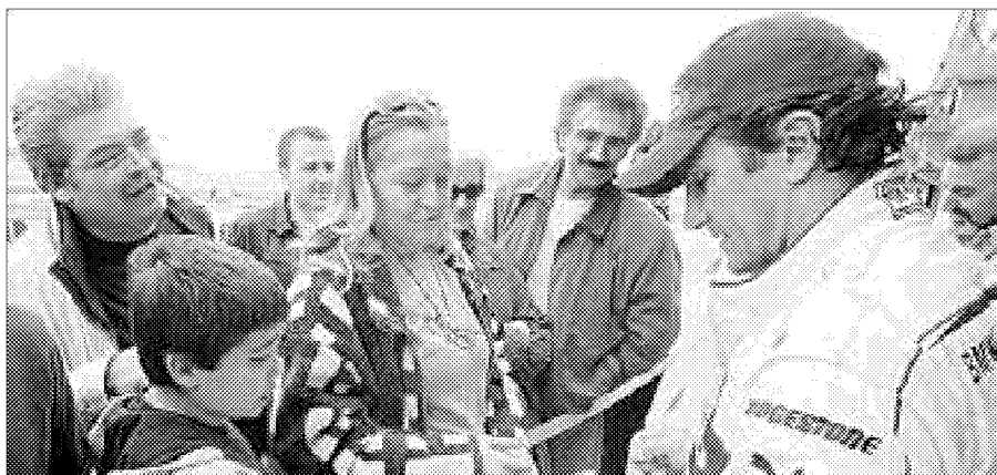
Alessandro "Alex" Zanardi Il pilota bolognese sostiene progetti di beneficenza