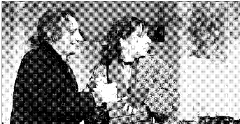
La nuova stagione del Teatro comunale di Russi si annuncia ricca