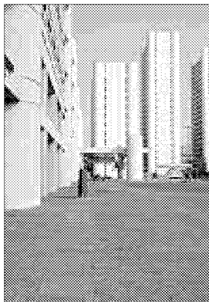
Le misure adottate dalla Regione

LUGO - Ticket sanitari azzerati per le famiglie colpite dalla crisi economica e prestazioni sanitarie a costo zero per i figli adottati e in affidamento. Lo stabilisce la misura adottata dalla Regione, in vigore dal 1 agosto scorso. Il primo provvedimento riguarda le persone che hanno perso il posto di lavoro a partire dal 1 ottobre 2008 in poi, o che si trovano in cassa integrazione straordinaria, ordinaria o in deroga, in mobilità o con contratto di solidarietà. Per usufruire di queste misure straordinarie le persone che si trovano nelle condizioni previste dovranno compilare un modulo di autocertificazione all'atto della prenotazione o della