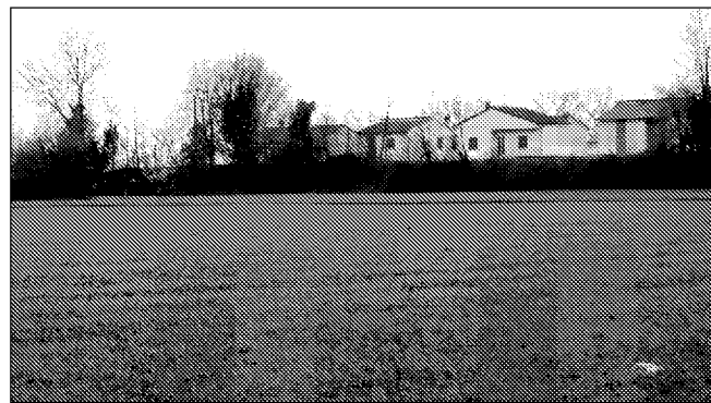
La zona di via Olmo dove i cittadini protestano

Protesta nella frazione di Belricetto Attendono una risposta dal 2005