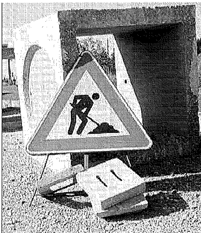
Strade da rifare, i Comuni dividono oneri e costi

Per saltare questo ostacolo le amministrazioni pubbliche hanno deciso di fare squadra applican-