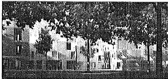
Ecco come diventerà piazza XIII Giugno dopo la riqualificazione

L'intervento si identifica come un intervento di architettura sostenibile: gli edifici saranno do-