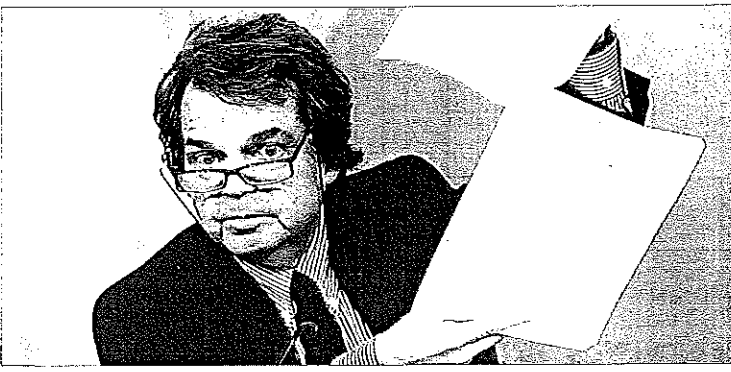
Renato Brunetta Il ministro tuona contro i medici dal "certificato facile"

FAENZA - Dopo un anno di "cura Brunetta", si può affermare che i dipendenti pubblici stanno scoppiando... di salute. Lo confermano i dati forniti dal ministero per la Pubblica amministrazione: in particolare si tratta della rilevazione sulle assenze per malattia dei dipendenti pubblici nella Regione Emilia-Romagna riferiti all'aprile scorso, confrontato con lo stesso periodo del 2008, non prendendo in considerazione le amministrazioni con meno di 50 dipendenti. I cali più vistosi dalle nostre parti sono quelli dei Comuni di Cesenatico e Lugo, ma a tallonare si danno da fare la Provincia di Ravenna e il Comune di Faenza; variazioni minori nell'imolese fra Comune e Ausl. L'insospettabile Comune di Cesenatico brilla dunque con un bel 69,2 % in meno di assenze per malattia nell'aprile 2009 rispetto allo stesso mese