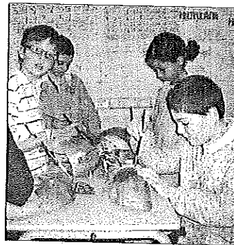
Alunni impegnati nei laboratori

LUGO. È arrivata la sera della "Fera". Nel tardo pomeriggio di oggi, alle 18, all'interno del Pavaglione in primo piano c'è la "Fera de Lugo", ovvero il mercato dei bambini. Si tratta dell'ultimo atto del Progetto scuola "C'era una volta... a spasso per Lugo tra medioevo e rinascimento" promosso dalla Contesa Estense insieme alle associazioni Avis, Aldo, Admo, Gli Amici Del Tondo, Amici Di Lugo Estense, con il coordinamento tecnico e pedagogico dell'Associazione Miele (Multidisciplinarietà interattiva e laboratori educativi), e con il supporto tecnico di "Per gli altri", Csv di Ravenna, in stretta collaborazione con le scuole. Un appuntamento di rilievo nella rassegna Contesa Estense, un mercato medioevale di piccoli mercanti ed artisti, che coinvolge 28 classi delle scuole primarie di Lugo: Codazzi, Garibaldi, San Giuseppe, Sacro Cuore per un totale di 600 bambini. Hanno partecipato ai laboratori pratici e storico geografici, mirati a creare un legame diretto, vissuto e personale con la storia, attraverso un viaggio immaginario nel '400 e '500, ed in particolare al tempo della dominazione estense a Lugo. Un'opportunità per ogni alunno che lo porterà a scoprire e conoscere i momenti di vita quotidiana, le arti, gli usi, i miti ed i protagonisti di quel periodo. Dunque centinaia di alunni saranno partecipi oggi