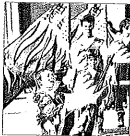
Tutta per i giovanissimi la scena della Contesa