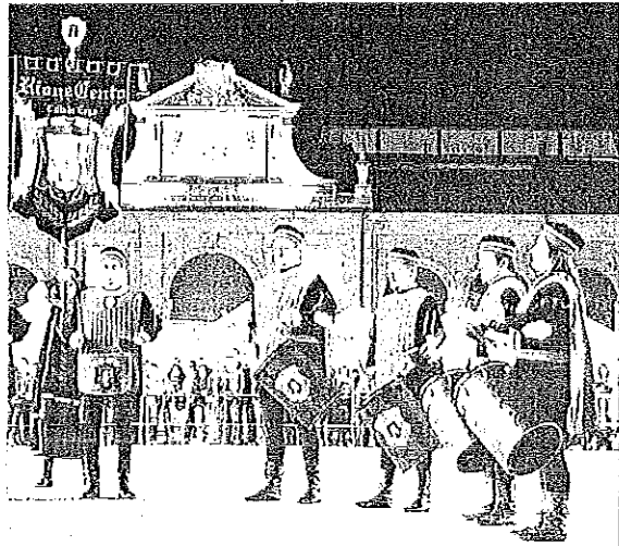
Non solo Palio per la Contesa Estense