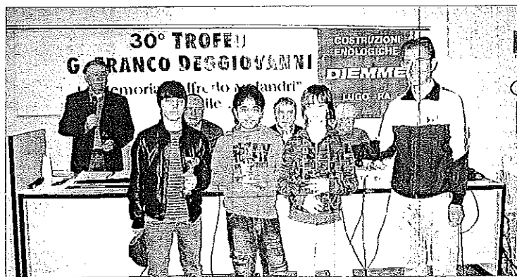
Le premiazioni della 30esima edizione del trofeo Deggiovanni