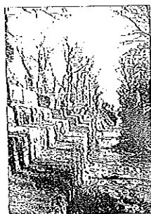
I gradoni lungo il Canale dei mulini

LUGO - Si torna domani lungo il canale dei mulini. Dalle 14 alle 18, la Lista civica dei comitati e il comitato Dernier Regard, sarà sul luogo simbolo della partecipazione dal basso alla vita politica lughese, quel canale a ridosso della tanto contestata lottizzazione sul prato di via Villa. «Invitiamo tutti i cittadini di Lugo ed in particolare quelle centinaia che ogni settimana percorrono a piedi e in bicicletta il sentiero lungo il Canale, a partecipare alla pulizia del Canale dei mulini tra il ponte delle lavandaie e la chiusa verso l'ex molino Figna», dicono dalla Lista. Che pure, non può non denunciare l'azione dei vandali sui gradoni del manufatto del ponte e che per questo non saranno oggetto di intervento da parte dei volontari: «Il lavoro di ripulitura di questi gradoni, se non eseguito con appositi accorgimenti rischerebbe di compromettere ulteriormente la loro stabilità» per cui Lista dei comitati e Dernier Regard si chiedono se l'amministrazione comunale si sia accorta di tale vandalismo. Pur rendendosi disponibili a svolgere gratuitamente la pulizia sotto la guida di tecnici della Sovrintendenza in qualsiasi momento, i volontari domani procederanno con la pulizia del fondo e delle sponde di quel tratto del Canale dei Mulini. Nell'occasione sarà possibile firmare per la presentazione della Lista civica dei comitati.