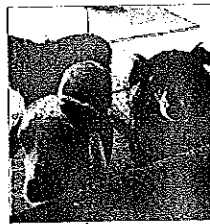
Il canile scoppia, l'appello: adottate i cuccioli

A Lugo appello delle associazioni "Adottate i cuccioli, il canile scoppia"