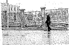
Servizio a pagina 19

UOVI passi avanti per il progetto di riqualificazione dell'area nota a Lugo come 'ex Consorzio agrario', che si affaccia su via Acquacalda. Già adottato in consiglio comunale, il progetto, che cambierà completamente il volto dell'area interessata, riapproderà presto sui banchi del 'parlamentino' lughese per l'approvazione definitiva e tra circa un mese i lavori potrebbero già prendere il via.