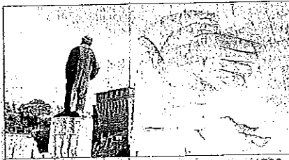
In tutto il comune sono andati a votare 1.739 cittadini. Per il Pd «un buon risultato»