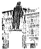
Servizio a pagina 15

La Bassa Romagna torna soggetto delle tesi di laurea