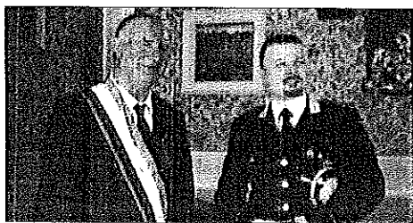
LUGO. Il sindaco di Lugo Raffaele Cortesi ha ricevuto in Municipio il comandante della compagnia carabinieri di Lugo Maurizio Biancucci, promosso al grado di capitano. Durante il breve incontro avvenuto nell'ufficio del primo cittadino lughese, Cortesi si è complimentato con il neo capitano dell'Arma augurandogli buon lavoro.