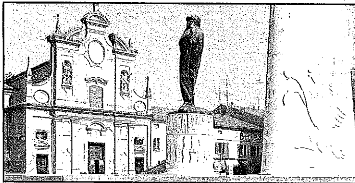
Uno fra i simboli della città, il monumento a Francesco Baracca

Presentato il concorso per tesi di laurea