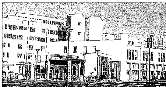
Gruppo di mutuo aiuto al lavoro per tutelare il malato e tentare di migliorare il servizio sanitario locale