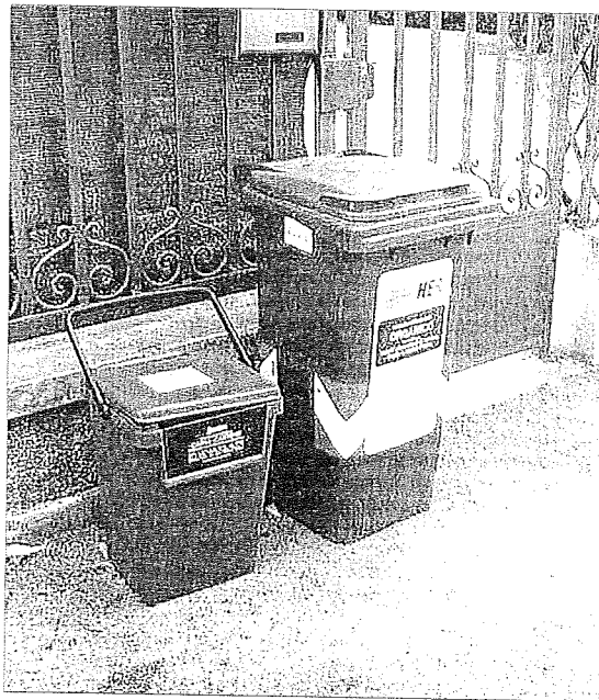
Differenziata integrale del pattume al via in febbraio