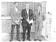
Servizio a pagina 16

In un vademecum consigli utili per prevenire i raggiri a danno degli anziani