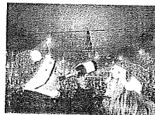
Alle pagine XVIII e XXII