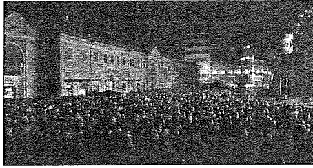
La festa dell'anno scorso

Una live band (circa 60 concerti all'anno) che mischia brani originali contenuti nel disco d'esordio "Dirty Roads" e cover di rock, folk e rockabilly con una energia ed un coinvol-