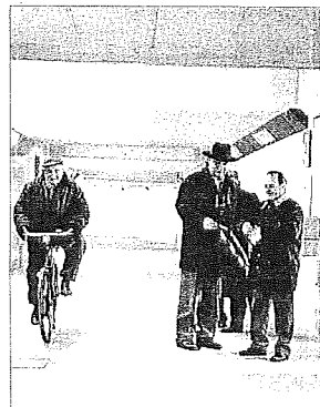
Nella pancia del sottopasso si scaldano i muscoli prima della salita

Per sbucare dall'altro lato, ci sembra che qualcuno abbia pensato più alla salita al Mont Ventoux, terribile scalata del Tour de France, che ad una passeggiata in bici per casalinghe con spesa al seguito. Ma tant'è: dopo rinvii e ritardi biblici, il sottopasso ciclopedonale della stazione lughese è stato spaccettato, proprio all'antivigliia di Natale. Ora il quartiere di Madonna delle Stuoie è direttamente collegato al centro di Lugo. Vista la pendenza, utilissimo per allenarsi al Tour 2009.