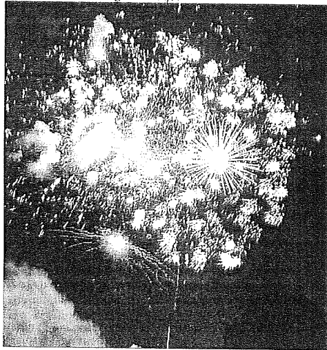
E' scattato il conto alla rovescia mancano poche ore alla mezzanotte che sancirà la fine del 2008 e l'inizio del nuovo anno