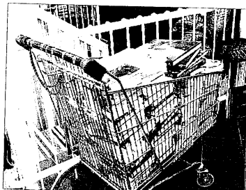
Seminar libri Biblioteca in divenire al Globo

"Seminar libri", nato nel 2003 all'ipercoop Esp di Ravenna e diffuso oggi in 15 negozi della Cooperativa, è il progetto di Coop Adriatica che, sull'esempio del "book crossing", consente di condividere e diffondere gratuitamente il piacere della lettura. Da oggi, anche i frequentatori del punto vendita di Lu-