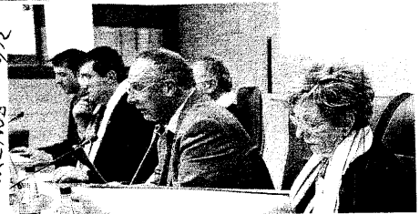
Le iniziative lughesi sono state presentate a Villa Maria Cecilia, partner del Comitato locale