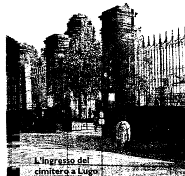
L'ingresso del cimitero a Lugo

destra per i veicoli che percorrono via Villa provenienti da Villa S. Martino, all'incrocio con via Canaletta; obbligo di proseguire diritto o svoltare a sinistra per i veicoli che percorrono via Villa provenienti da Lugo all'incrocio con via Canaletta. Divieti e sensi unici riguardano anche, per quanto riguarda le frazioni, le zone di via Fiumazzo a Voltana; via Stradone a San Bernardino; via Fiumazzo a San Lorenzo; via Ripe e via Pigno a Villa S. Martino; via Bizzuno a Bizzuno; via Cimitero, via Navacchio, via Palazza e via San Potito a San Potito.