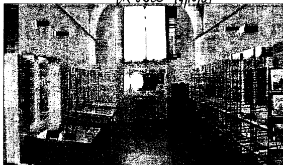
Biblioteca Trisi aperta domenica prossima per la giornata della cultura

archivi attinenti al coinvolgimento delle amministrazioni locali nella generale mobilitazione bellica, per il 90° anniversario della Grande Guerra di cui si ricorderà la fine giusto fra poche settimane.