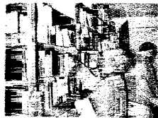
Servizio a pagina XV

In occasione dell'Open Day, musei e sale lettura della provincia propongono eventi per tutta la giornata del 19 ottobre