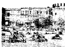
Servizio a pagina XVII