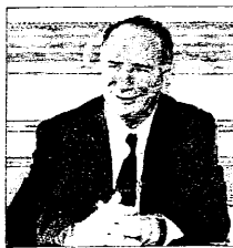
Il sindaco di Lugo Raffaele Cortesi