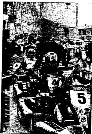
Kart in gara per le vie di Lugo

del Comune, della Provincia, di Motorvalley, del ministro per le Politiche giovanili e attività sportive e del ministero delle Infrastrutture e trasporti. Oggi per tutta la giornata, continua, nel Pavaglione "Rombi expo", esposizione di auto, moto, accessori, abbigliamento per gli amanti dello sport e, in Piazza Baracca alle 15 ed alle 17.30 "Moto freestyle show", spettacolo ed evoluzioni da urlo con Stefano Minguzzi, re del freestyle italiano ed europeo, e i suoi freestylers, mentre in Corso Garibaldi, ha luogo un raduno di motociclisti e appassionati delle due ruote. Il tutto a far da cornice al "Memorial Alfredo Melandri", 11ª edizione, ospitato, dalle 9 alle 17 in Piazza Garibaldi. Come ogni anno, vip istituzionali, dello sport e dello spettacolo, piloti e imprenditori si sfidano sui kart.