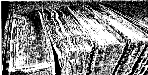
Via la polvere dai libri Occhi al cuore delle pagine con Caffè letterario