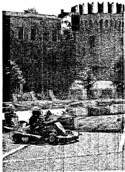
con un programma intensissimo comprende anche l'ottava edizione del circuito rievocativo 'Francesco Baracca' per motociclette d'epoca