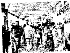
« Servizio a pagina XIII