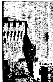
Un'esibizione di freestyle