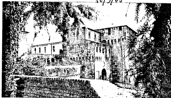
La Rocca In crescita costante gli incassi dalle contravvenzioni stradali

vano quei denari? "Anzitutto - spiega il comandante della municipale lugheese, Elena Fiore - dal mancato utilizzo delle cinture di sicurezza o dall'uso scorretto dei seggiolini per i bambini in auto". In calo, aggiunge la Fiore, le multe stacca-