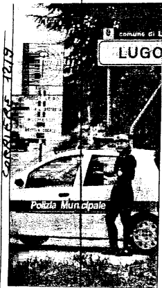
Vigili urbani al lavoro