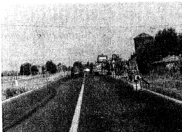
ANAS Operai al lavoro per tagliare erba e sarmanti lungo la Statale 16 'Reale', all'altezza del ponte di Bastia

LA FARMACIA comunale numero 2 di Lugo (via di Giù), riaprirà lunedì 15: si stanno eseguendo infatti lavori di ristrutturazione. Per limitare i disagi sono stati modificati gli orari, sia diurni che notturni, delle altre farmacie comunali di Lugo: la numero 1 (in via Provinciale Felisio 1/2) e la numero 3 (in via De' Brozzi 18/2). Per quanto riguarda il solo servizio notturno, la farmacia numero 2 riprenderà regolarmente il proprio servizio venerdì 3 ottobre.