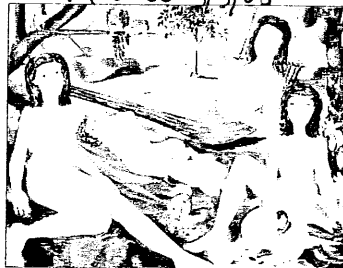
Una delle opere della pittrice colombiana in mostra a Lugo

corsi di disegno per migliorare la propria tecnica. Nella sua pittura si celano i ricordi della sua giovinezza immersa in splendidi paesaggi lussureggianti. I suoi personaggi, velati di tristezza o angoscia, ricordano la sua tormentata, amata e indimenticata terra. I dipinti raccontano, appunto, la nostalgia di questa patria lontana: la Colombia, del suo passato, delle sue credenze e tradizioni. Nostalgia che trapela dal suo raccon-