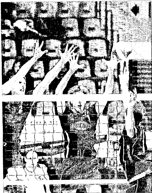
In Volley, la nuova società bassoromagnola nata dall'unione di forze e risorse delle squadre del Lughese