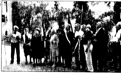
La cerimonia al cippo dedicato alle vittime del nazifascismo di Savarna