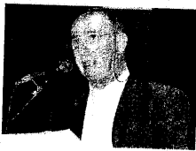
Servizio a pagina XXV