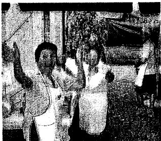
VOLONTARIE Le cuoche di Voltana preparano le 'prelibatezze' per la festa