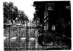
☞ Servizio a pagina XXII