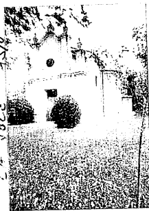
All'Arginino da oggi fino a venerdì