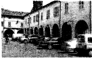
PIAZZA BARACCA. I posti auto che da oggi saranno utilizzabili solamente a pagamento

ENTRANO in vigore da oggi, venerdì, a Lugo importanti novità per quanto riguarda la circolazione e in particolare la sosta dei veicoli in alcune strade del centro, dove si parcheggerà solamente a pagamento. Le strade interessate a questa novità sono: via Garibaldi, nel tratto compreso tra via Codazzi e piazza Trisi; via Matteotti, dal civico 3/1 a piazza Baracca quindi è interessato il tratto più vicino al centro; via Risorgimento nel tratto compreso