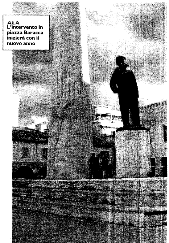
ALA L'intervento in piazza Baracca inizierà con il nuovo anno