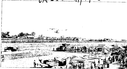
Il memorial day dedicato a Baracca ha attirato a Villa San Martino 6.500 visitatori