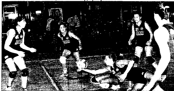
Premiazioni del Palio 2008 mercoledì prossimo alla piscina di Lugo

Nuovo trionfo dunque per i rappresentanti della zona nord lughese, un successo colto quest'anno solamente sul filo di lana per la bella concorrenza di Cotignola, Bagnacavallo e Lugo Voltana, le altre squadre