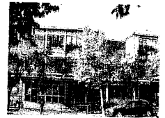
« Servizio a pagina XVI

Lugo Al via interventi straordinari di restauro per gli edifici di Scientifico e Compagnoni. Investimento da 200mila euro