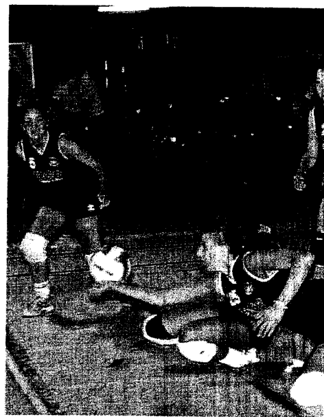
Una fase del torneo di pallavolo femminile, che ha visto il successo dell'Alfonsine con il punteggio di 3 a 1 sulla compagine del Bagnacavallo