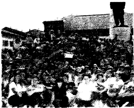
La grande passione dei lughesi per il ciclismo emerge ogni anno alla partenza del Giro di Romagna

Manca ancora il responso definitivo dei progettisti incaricati