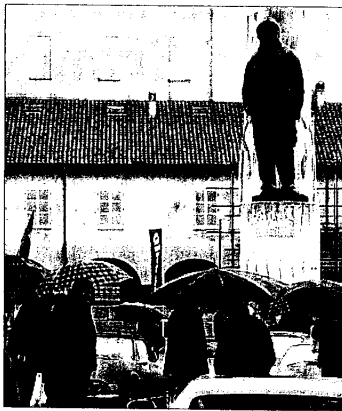
In attesa delle Freccie tricolori un convegno ricorda la figura dell'Asso dell'aviazione

LUGO - Il 2008 segna il centovesimo anniversario della nascita ed il novantesimo della scomparsa del grande asso dell'aviazione italiana Francesco Baracca. Per ricordare questa figura ormai leggendaria, il Comune di Lugo ed il Museo Baracca organizzano, in collaborazione con l'Aeronautica Militare, l'Aeroclub e l'Unuci di Lugo, una serie di appuntamenti che culmineranno in una manifestazione aerea in calendario domenica 6 luglio, all'aeroporto di Villa San Martino. L'apertura delle "celebrazioni" avverrà sabato 17 maggio, nella sala consiliare della Rocca, con un Convegno organizzato dal Museo Baracca con l'apporto dell'Ufficio storico dell'Aeronautica. La giornata di studi si propone di fare il punto sulle ricerche e le indagini più recenti relative alla figura di Baracca e alla fase pionieristica dell'aviazione, analizzando gli aspetti storico-culturali che rendono ancora così attuale il 'mito' dell'asso romagnolo. Inizio dei lavori previsto alle 9.30; la chiusura attorno alle 17, con una pausa dalle 13 alle 15. Il programma è disponibile sul sito Internet del museo: www.museobaracca.it .