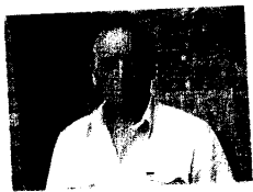
Servizio a pagina XV

Comunisti e Verdi: «Non cambia nulla a livello locale»