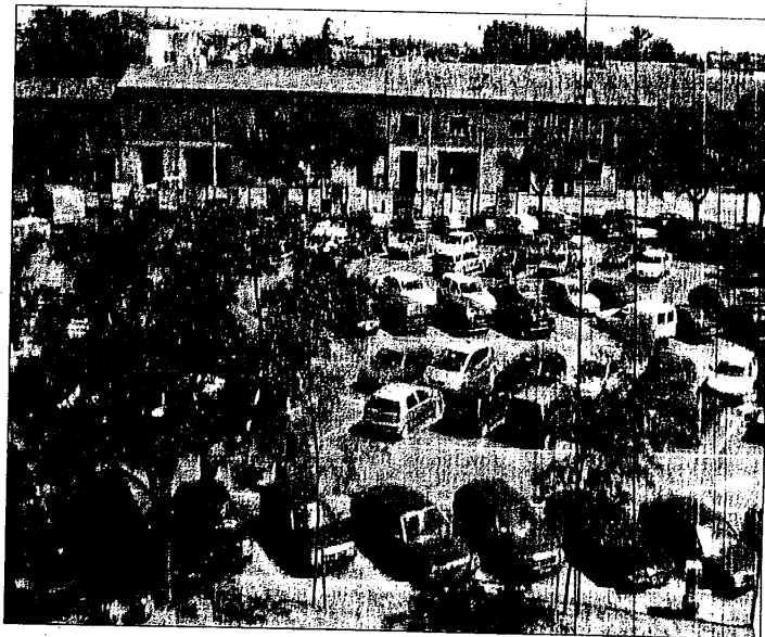
Confermata la sosta gratuita con disco orario per due ore in piazza Garibaldi

con l'unica eccezione dell'ultimo punto «trovato interessante dal sindaco», ha bocciato le osservazioni. L'elenco dei no si allunga andando a controllare anche gli altri punti presentati dagli azzurri. Quindi no alla richiesta di aumentare i controlli del livello di inquinamento atmosferico già rilevati dalle centraline Ar-