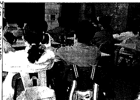
Contestate le politiche comunali per la scuola

Le contestazioni toccano anche quanto previsto dal bi-