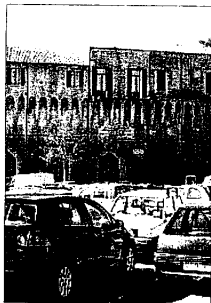
Vita più dura per chi lavora o abita in centro

LUGO - Siete lughesi? Abitate in centro e non avete un garage o un cortiletto dove parcheggiare? Dal primo febbraio lasciare l'auto davanti a casa negli stalli blu vi costerà di più. L'amministrazione Cortesi, infatti, ha appena ritoccato il prezzo degli abbonamenti agevolati per residenti. L'abbonamento residenti per lughesi che abitano all'interno della "Circoscrizione del Centro Storico" passa da 65 euro l'anno a 85.