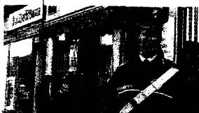
CONTROLLI Si pattuglia il centro

LUGO E' ENTRATO IN SERVIZIO DA QUASI DUE MESI