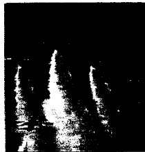
Le Frecce Tricolori a Lugo in memoria dell'eroe