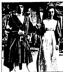
Figuranti in costume

LUGO. Sarà un palio molto più ricco e sicuramente più medievale. La quarantesima edizione della Contesa Estense che si svolgerà dal 10 al 18 maggio a Lugo promette nuove emozioni. Il programma di massima, contrariamente agli anni scorsi è già stato in larga parte definito.