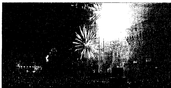
A sinistra i festeggiamenti per il nuovo anno in piazza. Sopra il sindaco Cortesi sul palco. A destra la piccola Vittoria, prima nata a Lugo, con i genitori