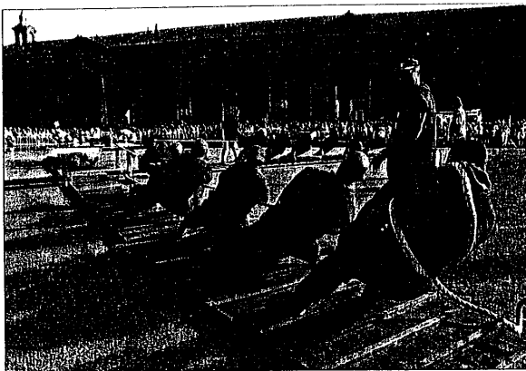
La Contesa estense nel 2008 presenterà alcune importanti novità. A lato della Caveja momento clou della contesa