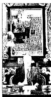
A gennaio l'incoronazione a presidente dell'Unione