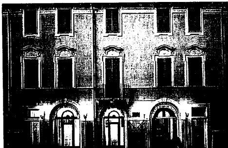
Nuovo appuntamento con la rassegna letteraria dell'Hotel Ala d'Oro