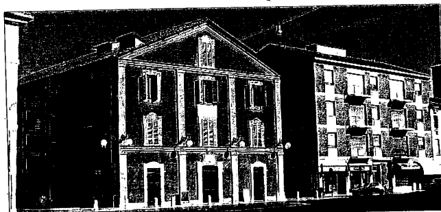
L'iniziativa sarà presentata questa sera al Rossini. Ospite il comico Giacobazzi

La presentazione e l'avvio ufficiale dell'iniziativa, che ha il patrocinio del Comune di Lugo e il contributo della Camera di Commercio di Ravenna, avverrà questa sera, alle 21, al Teatro Rossini, nel corso di una serata cui sono state invitate oltre alle imprese associate anche le autorità, e che si concluderà con un momento di divertimento affidato al recital di