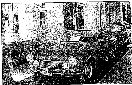
Le auto d'epoca in esposizione