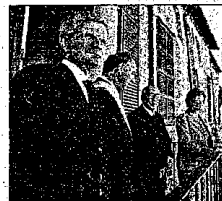
1° centenario della nascita dell'Eroe ricorda che il XXII settembre MDCCCLIX da questo balcone Garibaldi contro le insidie diplomatiche - e con in

Una lapide posta sotto al balcone recita: «Lugo nel