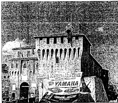
In sella per sfiorare i merli della Rocca