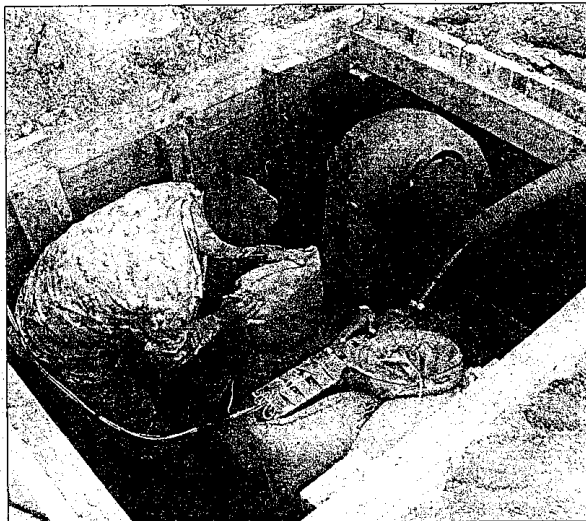
A sinistra la voragine dopo la deflagrazione; sopra le operazioni