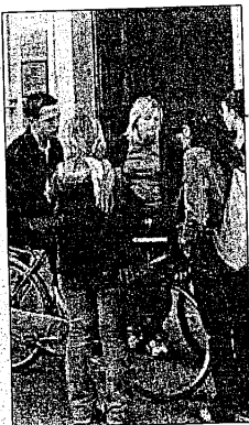
Studenti davanti a scuola

«Interventi, questi ultimi - precisa l'assessore provinciale all'Edilizia scolastica, Germano Savorani - di cui in effetti l'edificio necessita sia per le particolari condizioni di conservazione di