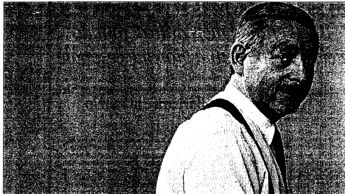
In novembre (8, 9, 10 e 11) Leo Gullotta è interprete di "L'uomo, la bestia e la virtù" di Pirandello