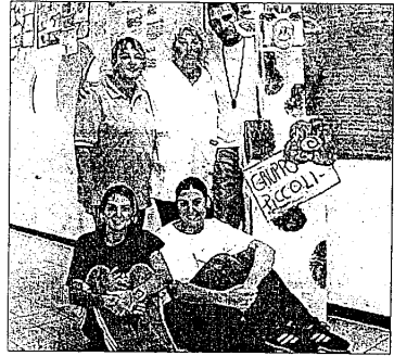
Gli animatori della coop La Giraffa

LUGO - Da diversi anni è un appuntamento fisso a conclusione del centro ricreativo 'Estate Giraffa'. E' il "party" al termine del percorso portato avanti durante l'estate presso la scuola Codazzi di Lugo. La festa del Cre estate 2007 si terrà venerdì, alle 21, presso il parco della casa protetta Sassoli, lungo il viale della stazione. Saranno gli stessi bambini i veri protagonisti della serata, creando un clima di partecipazione e di festa che coinvolgerà i genitori seduti in platea. L'ambiente verrà allestito, per l'occasione, con i disegni colorati dei giovanissimi, i cartelloni e i prodotti dei laboratori realizzati durante l'estate. La festa si rivela, di anno in anno, un momento di particolare emozione ed importanza per i bambini che lavorano alla preparazione dello spettacolo e per gli operatori e gli animatori che concludono il loro percorso di lavoro. "E' un momento di incontro - precisano dalla cooperativa sociale 'La Giraffa' - con le famiglie con le quali si è ormai instaurato, da tempo, un for-