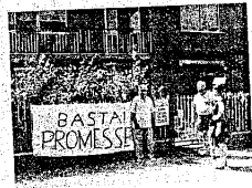
Servizio a pagina XVII