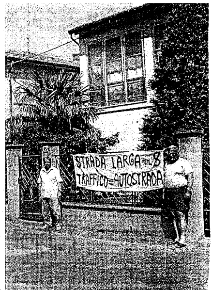
'LENZUOLA' Le proteste messe in atto nei giorni scorsi dai residenti in via San Giorgio esasperati per il continuo passaggio di mezzi pesanti